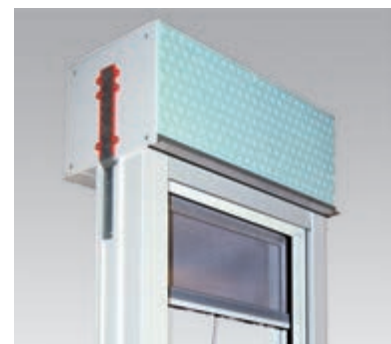
RollTop, raumseitig geschlossen mit Insektenschutzrollo