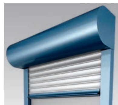
FrontTop II mit integriertem Insektenschutzrollo